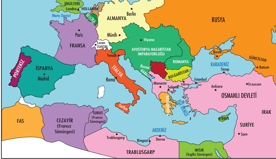
XX. Yüzyılın başlarında Avrupa ve Osmanlı Devleti

Verilen haritadan hareketle Osmanlı Devleti'nin sınırları ile ilgili aşağıdaki bilgilerden hangisine ulaşamaz?